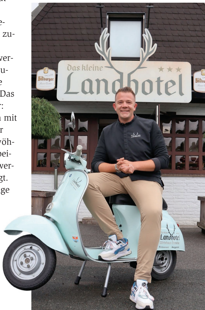
› Das Kleine Landhotel, Söltener Landweg 127, www.das-kleine-landhotel.de