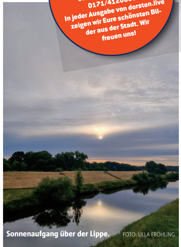
Sonnenaufgang über der Lippe.