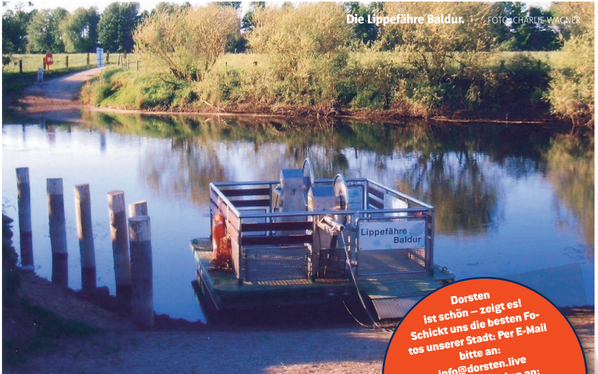
Die Lippefähre Baldur.